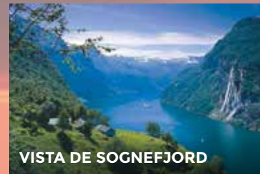
VISTA DE SOGNEFJORD

Esmorzar. Sortirem cap a Trondheim. Recorrem la ruta panoràmica i escènica coneguda com el camí de les Àligues , una sinuosa carretera amb un magnífic mirador prop d'un petit llac. Continuarem per carretera travessant la cèlebre