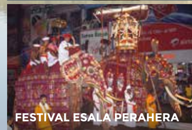
FESTIVAL ESALA PERAHERA